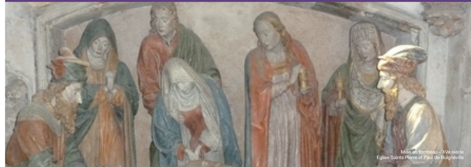
Mise au tombeau - XVe siècle Eglise Saints Pierre et Paul de Bulgnéville